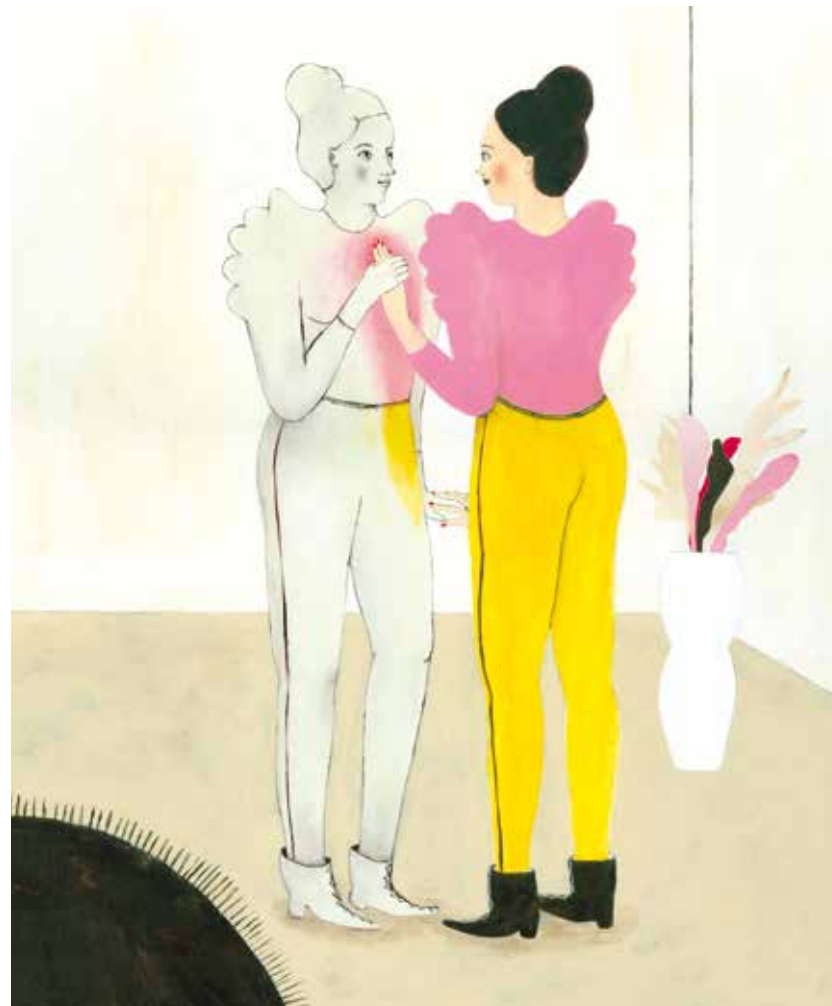
IMMAGINE FESTIVAL LA VIOLENZA ILLUSTRATA 2014

www.facebook.com/llustrAutrice www.facebook.com/Anarkikka www.facebook.com/Unchildren